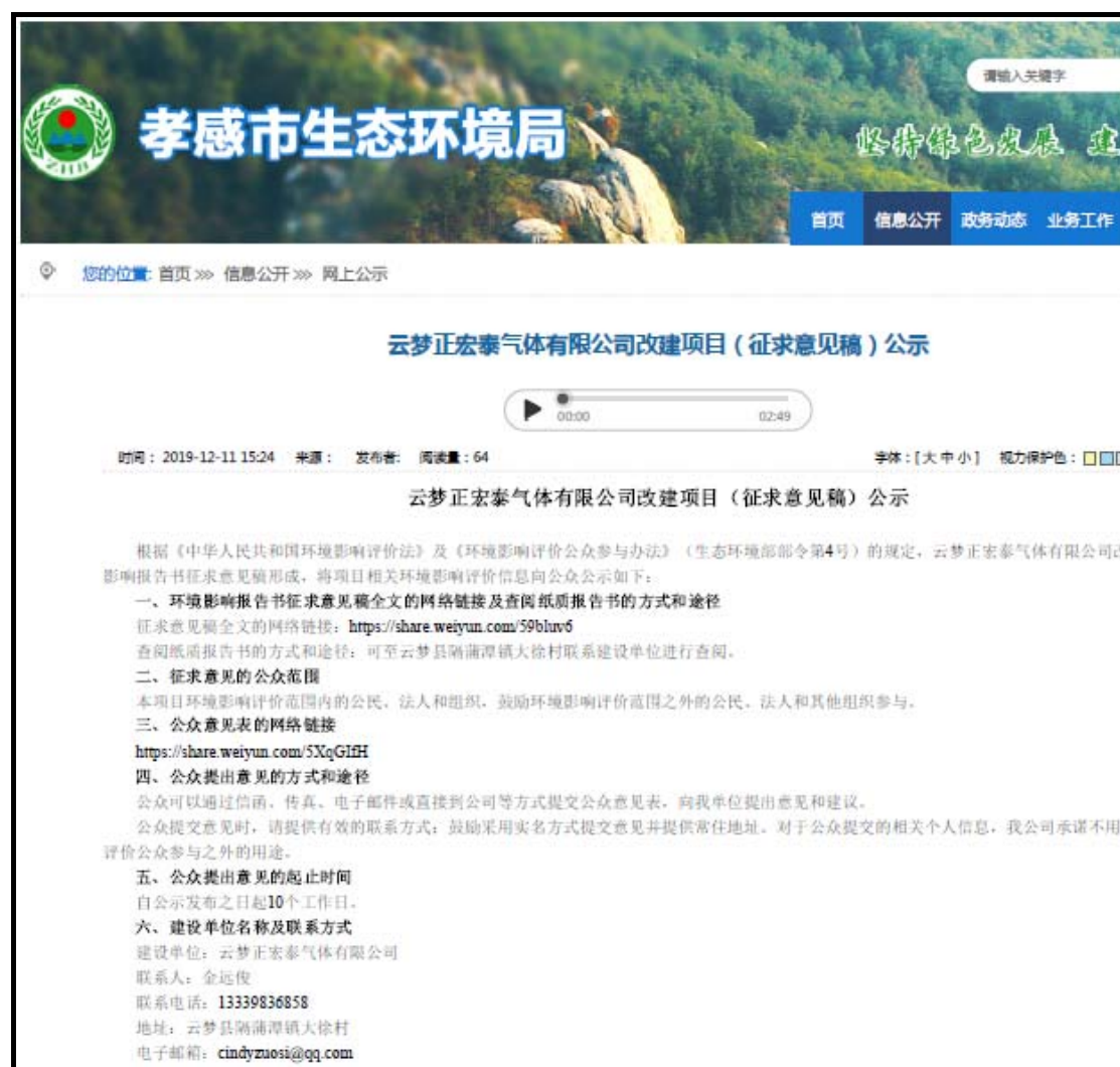
图 3-1 项目征求意见稿公示信息网上公示截图

本单位于2019年12月11日~2019年12月24日在孝感市生态环境局网站（ http://hbj.xiaogan.gov.cn/wsgs/621910.jhtml ）上将征求意见稿公开信息进行了公示，符合《环境影响评价公众参与办法》在项目所在地相关政府网站公示的规定，公示截图见图3-1。