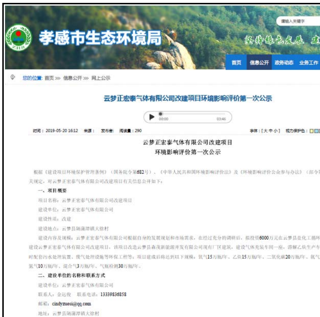
图 2-1 项目第一次公示截图

本单位于 2019 年 5 月 20 日在孝感市生态环境局网站（ http://hbj.xiaogan.gov.cn/wsgs/299750.jhtml ）对项目进行了第一次环境影响公示，符合《环境影响评价公众参与办法》在项目所在地相关政府网站公示的规定，公示截图见图 2-1。