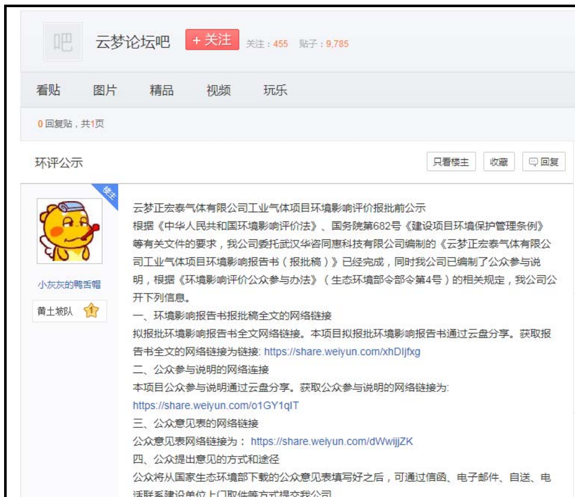
图 6-1 项目报批前公示截图

本单位于2020年8月10日在云梦贴吧网站 ( http://tieba.baidu.com/p/6357577723 ) 上将环境影响报告书报批稿及公众参与说明信息进行了公示，符合《环境影响评价公众参与办法》在项目所在地相关网站公示的规定，公示截图见图6-1。