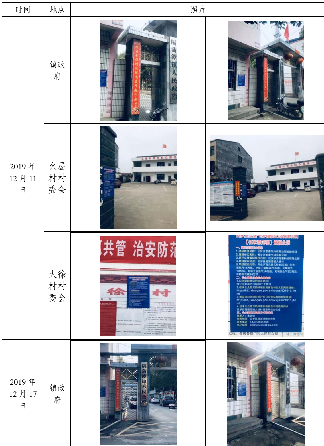
表 3-2 公告张贴的时间、地点及现场照片